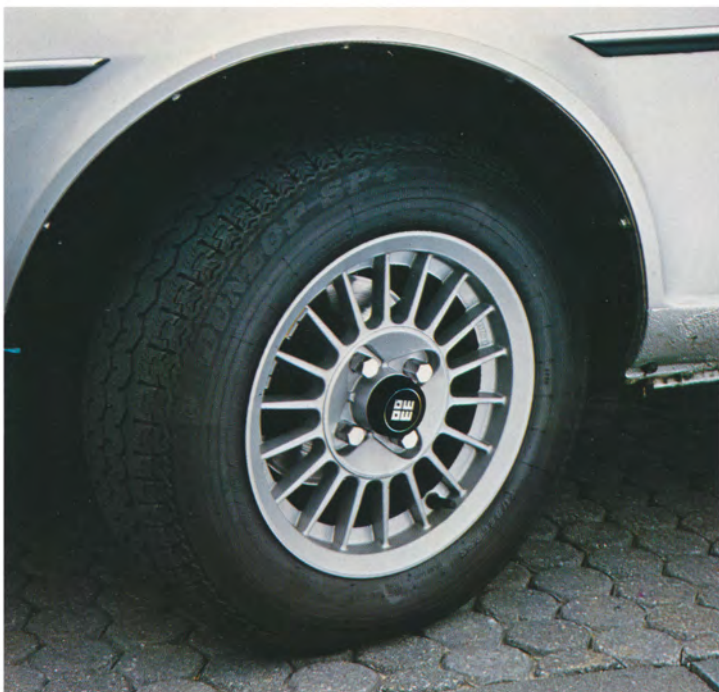
Breitreifen auf Leichtmetallfelgen.