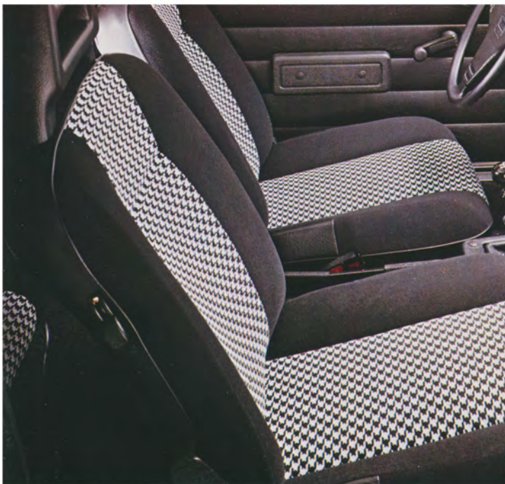
Sitzbezüge im Sportlook.