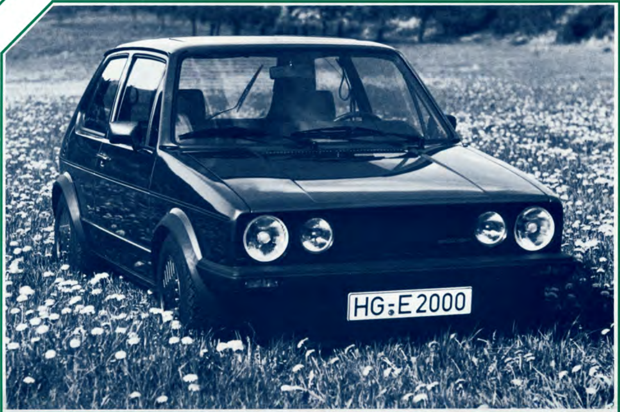
oetinger -Golf 2000 E. Doppelscheinwerfer-Grill und Leichtmetall-Felgen sind Sonderausstattung.

Denken Sie doch einmal darüber nach: Ein Golf mit zwei Litern Hubraum!